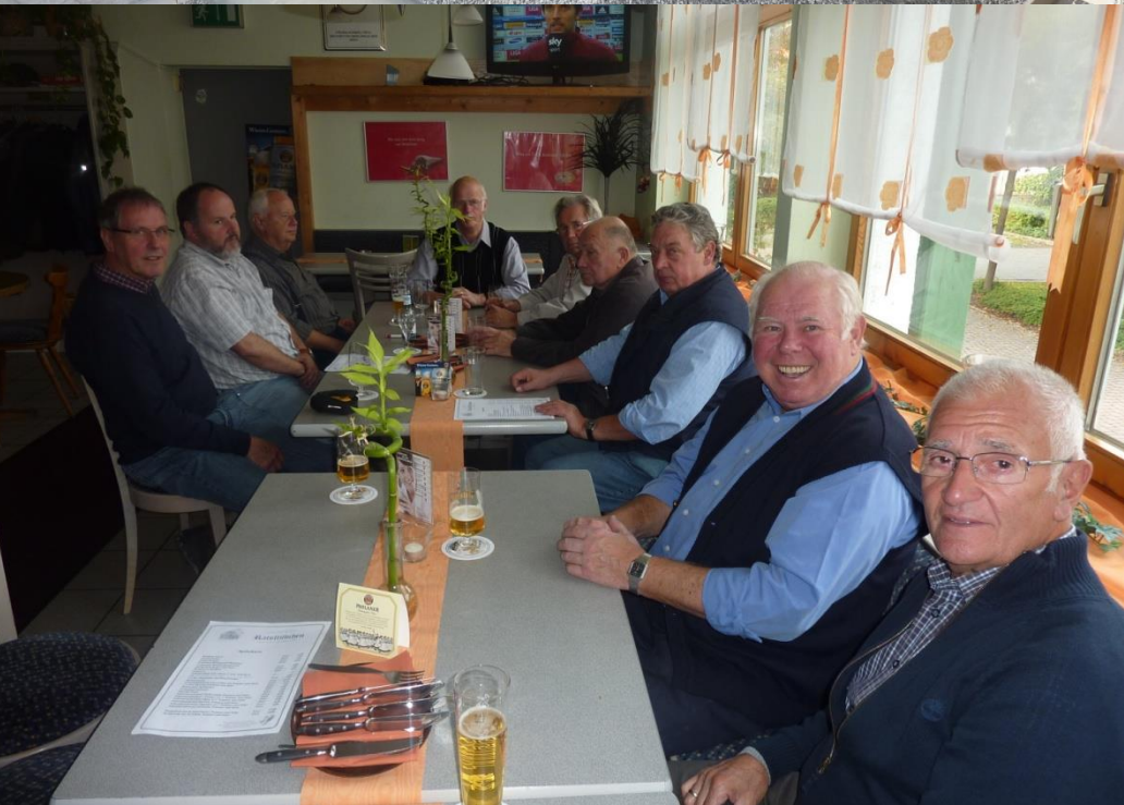
2010 09 25 Hahnstätten ➤ Schaefer-Kalk > Ratsstübchen