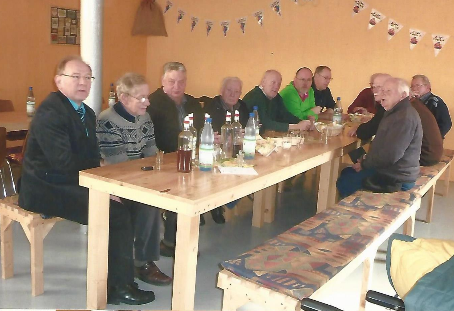
2013-04: Ebertshausen, Fischer