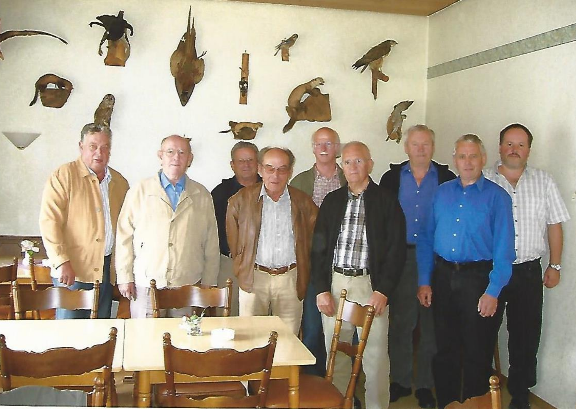
2008 09 14: Katzenelnbogen , Cafe Faust: 1.Treffen der Alterskameraden in der VG