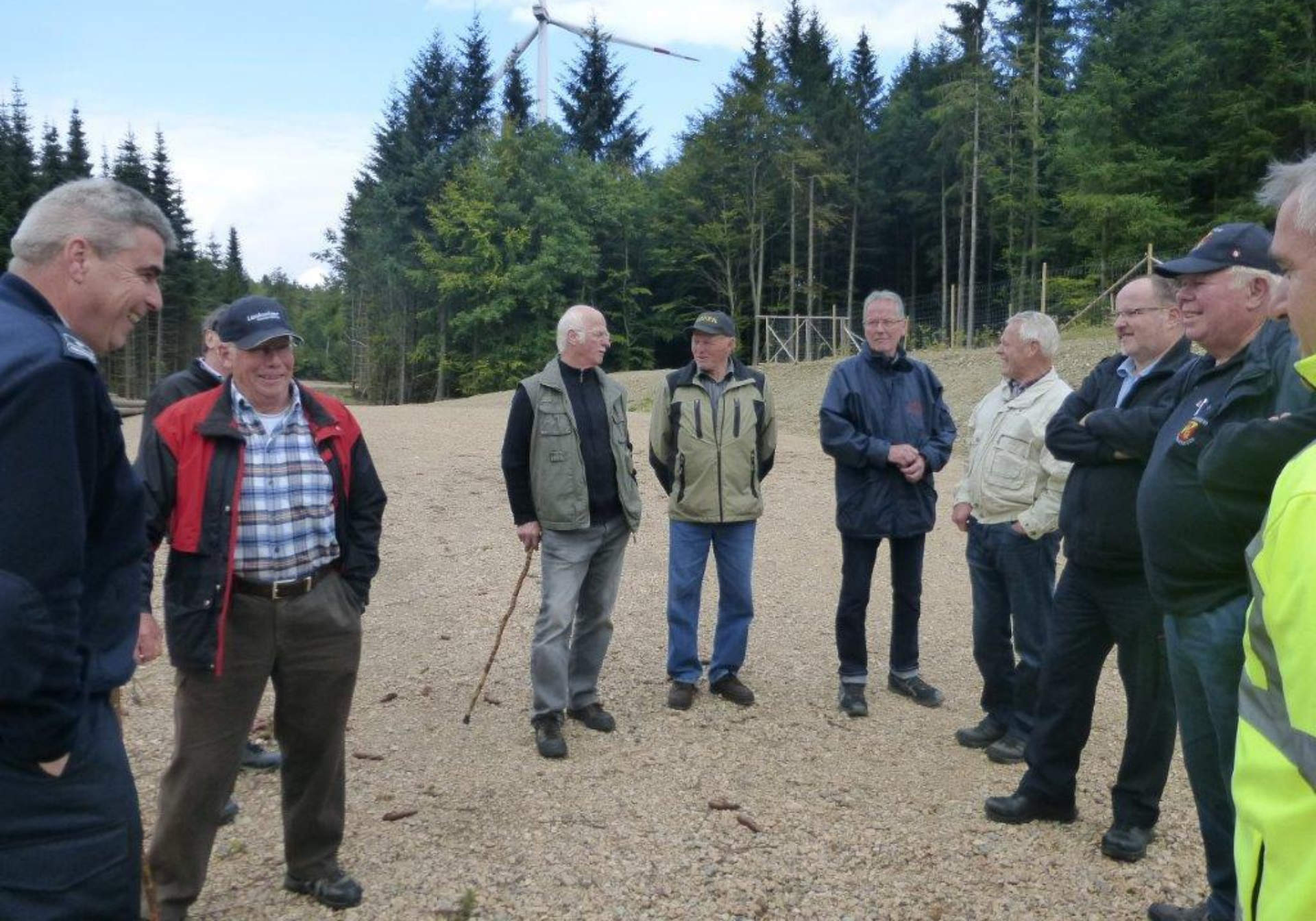
2015 09 26: Windpark Heidenrod